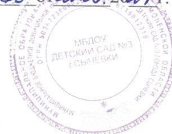
График аттестации педагогических работников МБДОУ детского сада № 3 г. Сычевки (01.09.2024г.)